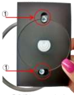
① Orifício para encaixe do parafuso.