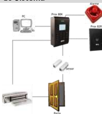
Diagrama de Conexão do Sistema

Para maiores informações sobre a compatibilidade do produto com controles de acesso, consulte o documento: Produtos Compatíveis com 82R no site www.cs.ind.br .